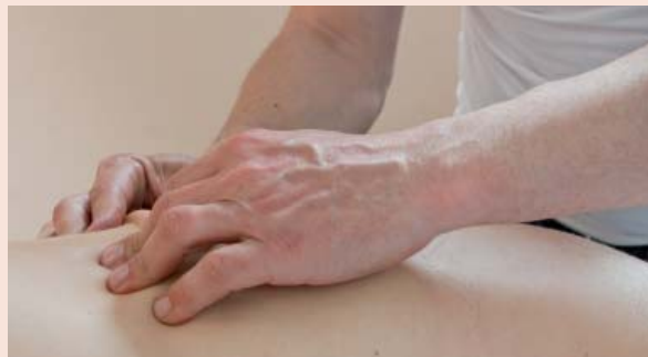
Gelenkblockaden lassen sich häufig durch eine Manuelle Therapie beheben.

Durch vorsichtiges Dehnen wird die Beweglichkeit des betroffenen Bereichs verbessert.